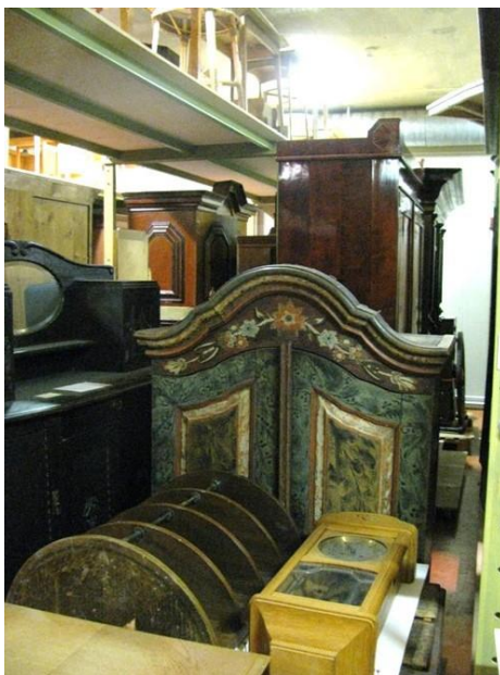
Varikolla esineitä joudutaan säilyttämään myös varastokäytävillä.